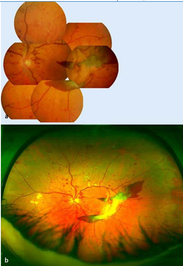
Abb. 1 ▲ Beispiel eines Auges mit proliferativer diabetischer Retinopathie (PDR) in der 7-Feld-Fundusfotografie nach ETDRS-Standard (a) und im dazu korrespondierenden Optomap-Ultraweitwinkel-SLO-Scan (b). Deutlich sind die präretinalen Blutungen am unteren Gefäßbogen und neovaskuläre Proliferationen zu erkennen. Im unteren Teil des Optomap-Scans sind Zilien und Teile des Lids zu erkennen