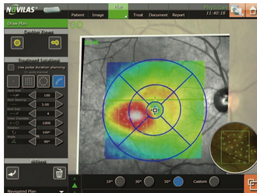
Abb. 2: Digitale Behandlungsplanung einer fokalen, navigierten Makula-Lasertherapie unter Einbeziehung externer OCT-Daten.