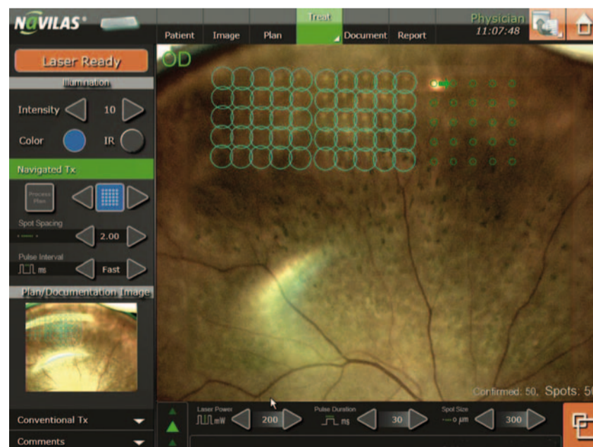
Abb. 3: Panretinale Laserphotokoagulation mit dem Navilas®-System: Durch „eye-tracking“ unterstützte Pattern-Laserherd-Applikation erlaubt auch in der Netzhautperipherie eine sichere Laserapplikation.

Bildgebung und digitale Lasertherapie in einem System, um Prozessvorteile zwischen Planung und Therapie nutzen zu können. Dabei beinhaltet es zum einen die umfangreiche Möglichkeiten retinaler Bildgebung (Infrarotbild, Farbbild, Fluoreszenzangiographie [FLA]), und zusätzlich auch umfassende Möglichkeiten einer computergestützten automatisierten Netzhaut-Lasertherapie. Mit dem Navilas®-System können sowohl Muster